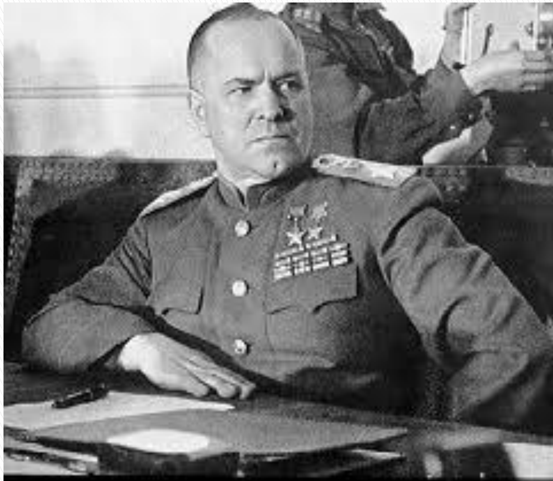
Первый заместитель Верховного Главного Командующего.