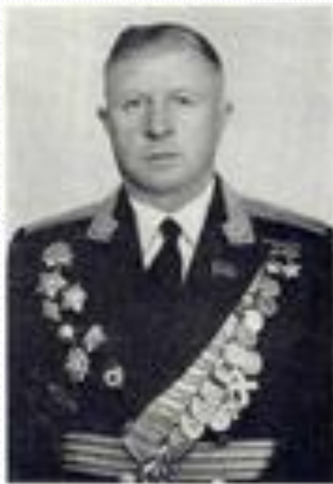
Генерал А.И. Родимцев